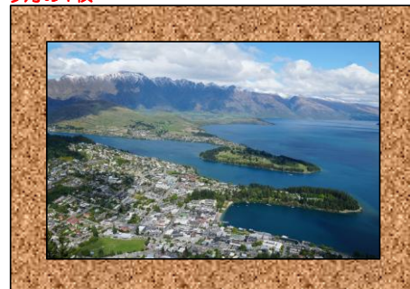
NZミルフォートサウンド